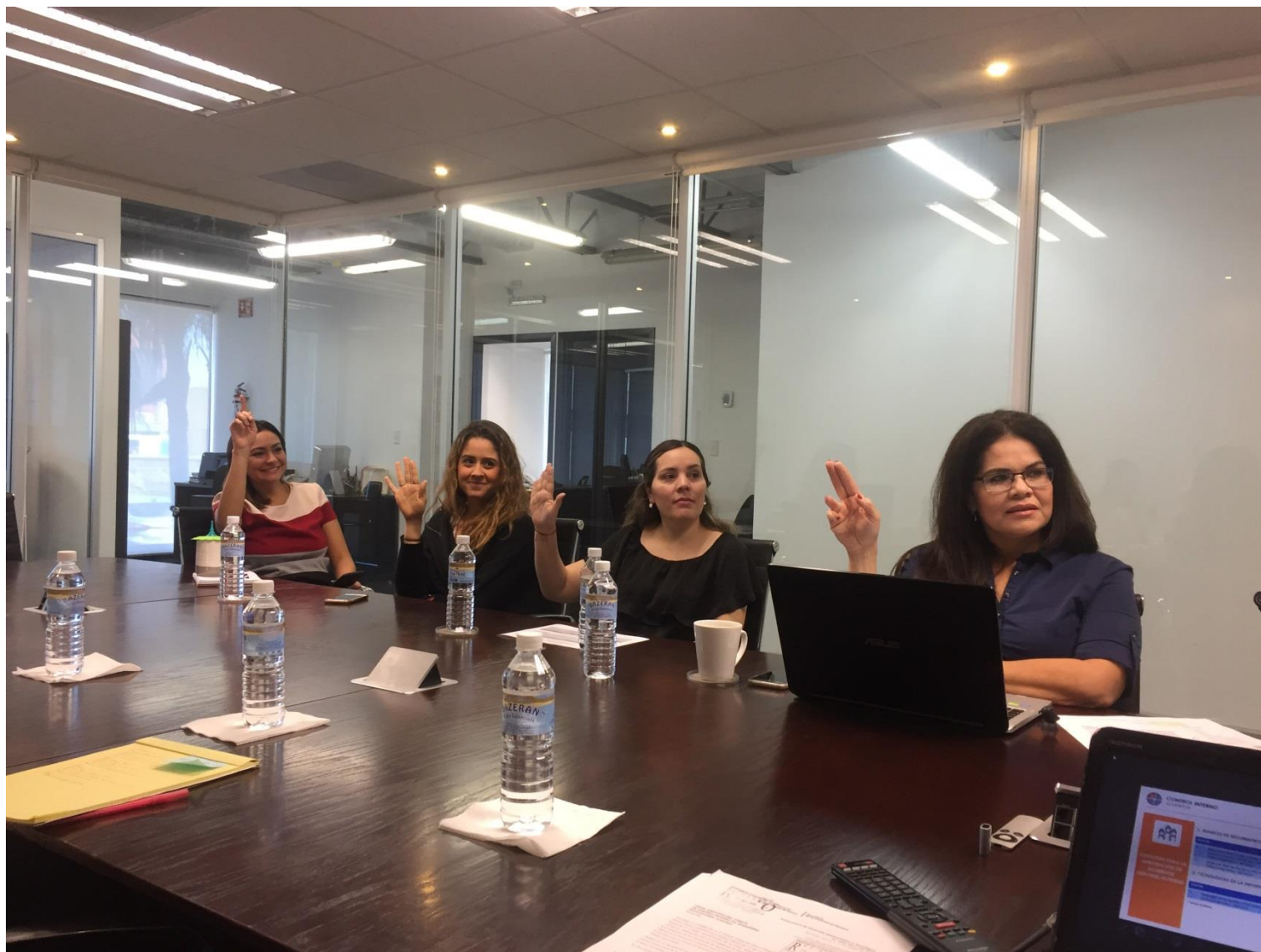
Evidencia Acta No. COCODI-003-PS-2019-30R Hermosillo, Sonora a 01 de Noviembre de 2019