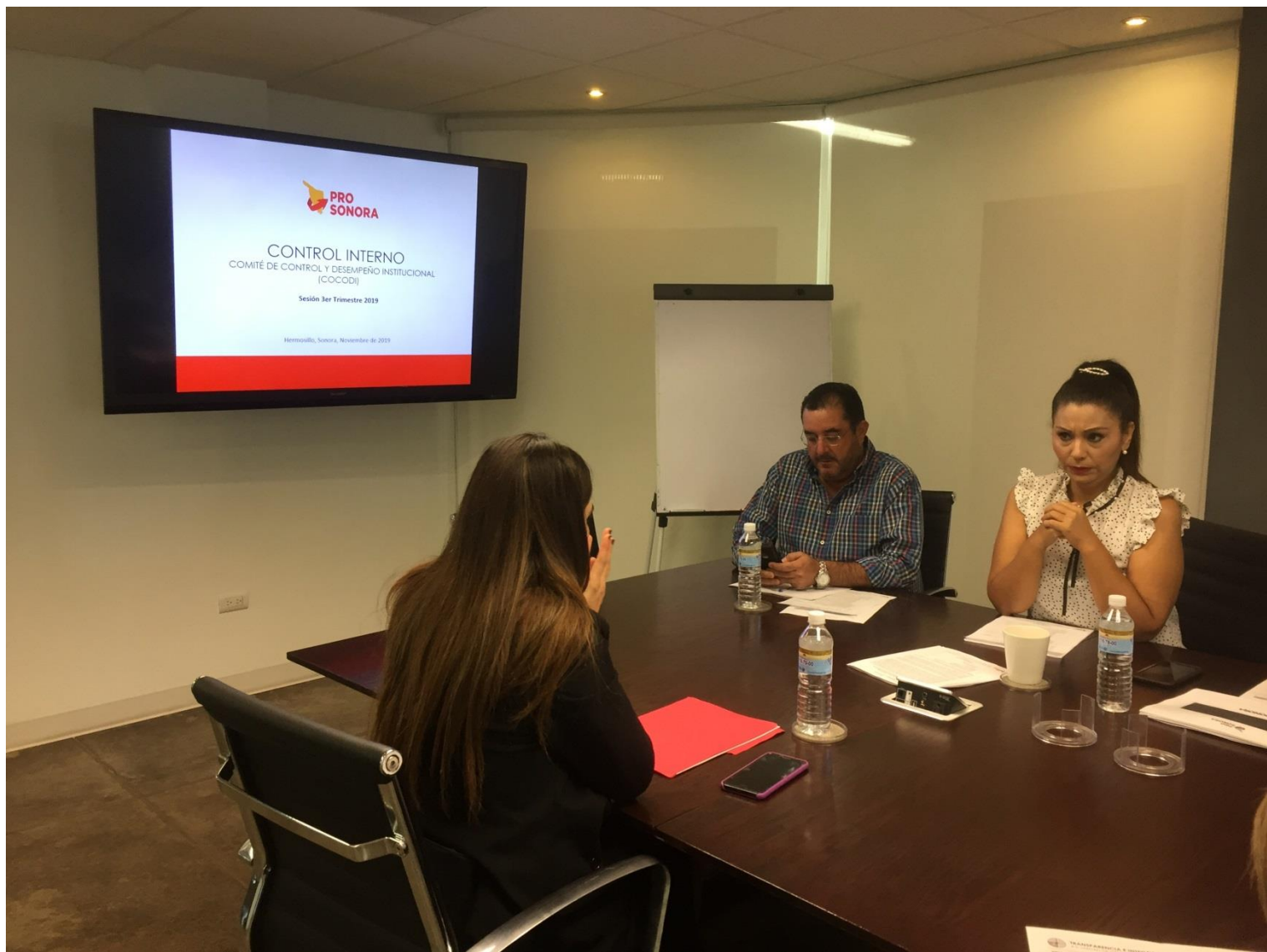
Evidencia Acta No. COCODI-003-PS-2019-30R Hermosillo, Sonora a 01 de Noviembre de 2019