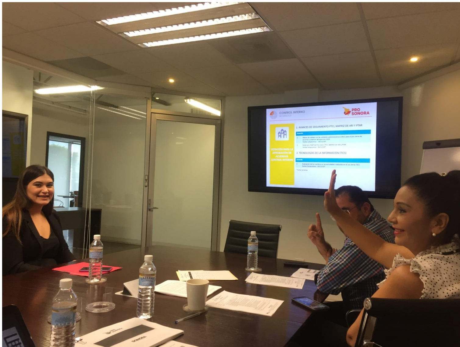
Evidencia Acta No. COCODI-003-PS-2019-30R Hermosillo, Sonora a 01 de Noviembre de 2019