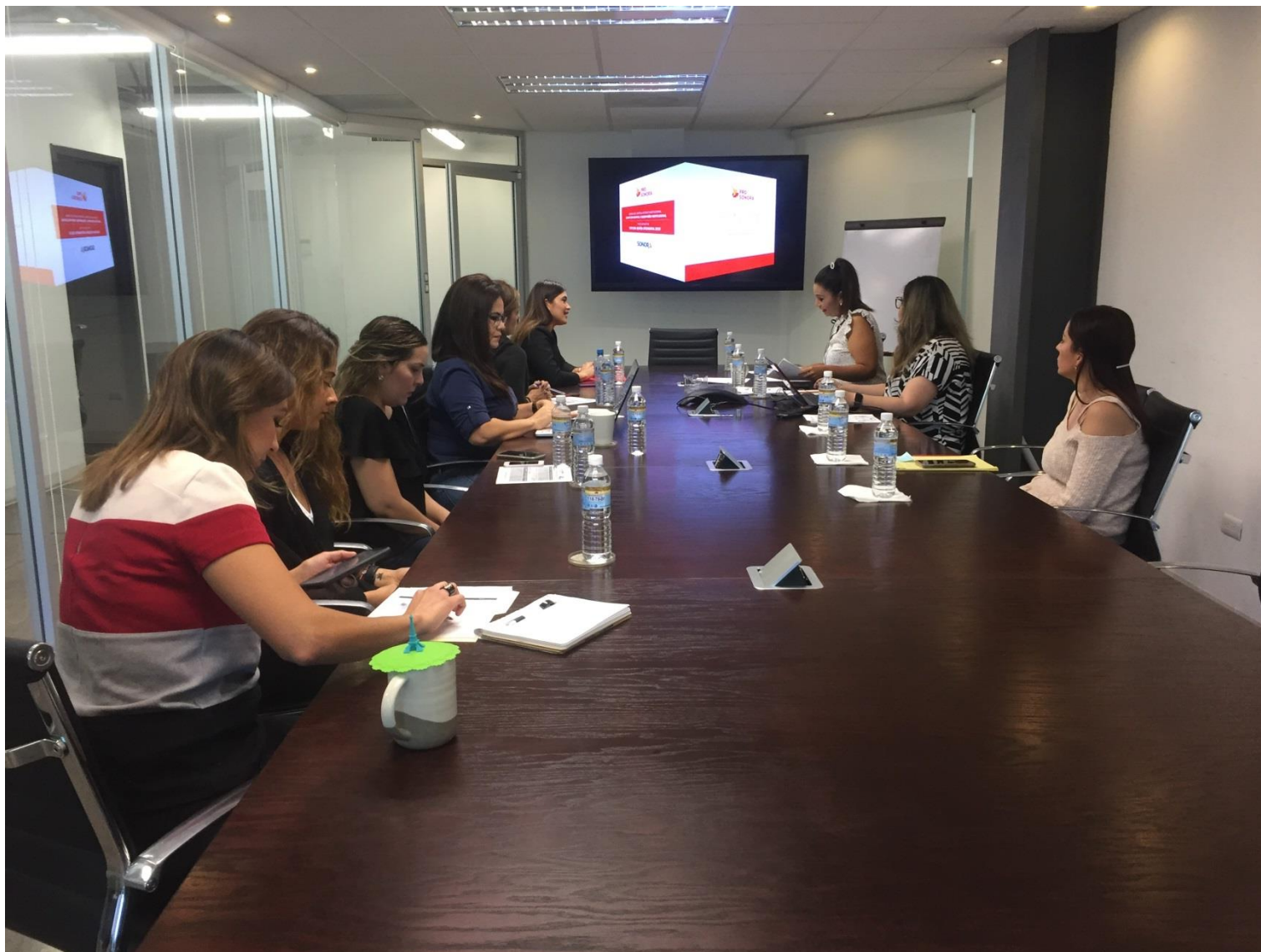
Evidencia Acta No. COCODI-003-PS-2019-30R Hermosillo, Sonora a 01 de Noviembre de 2019