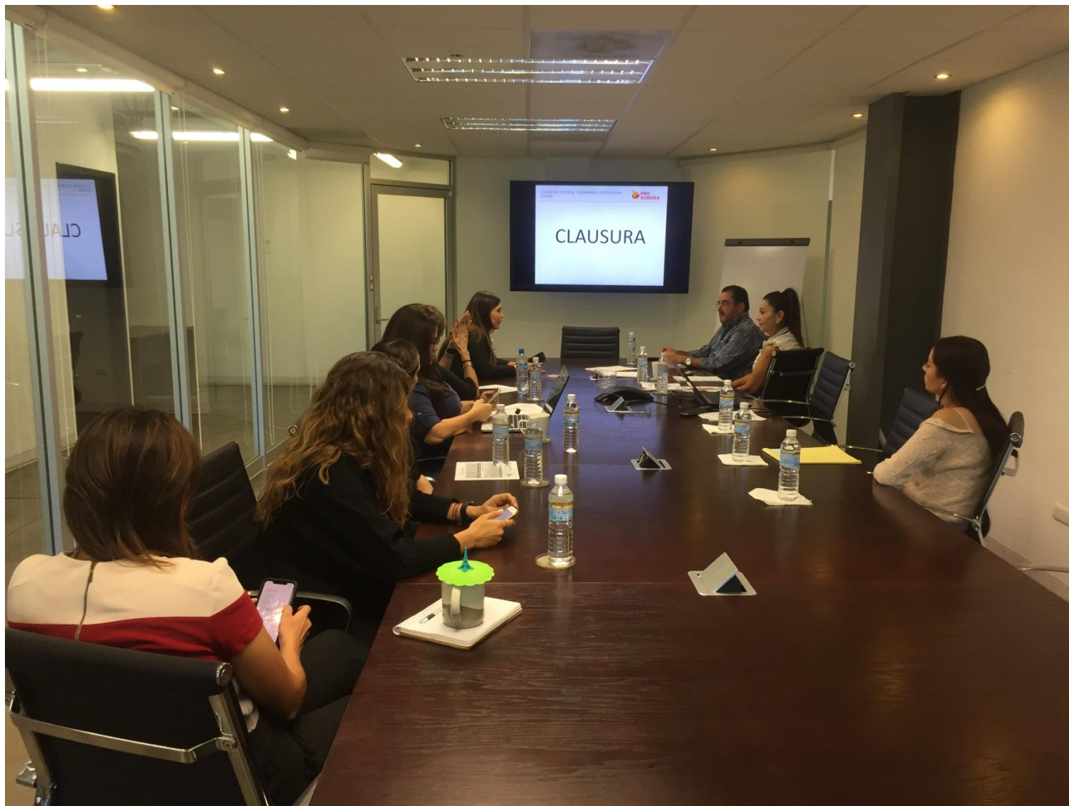
Evidencia Acta No. COCODI-003-PS-2019-30R Hermosillo, Sonora a 01 de Noviembre de 2019