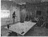
Capacitación Lengua de Señas Mexicana