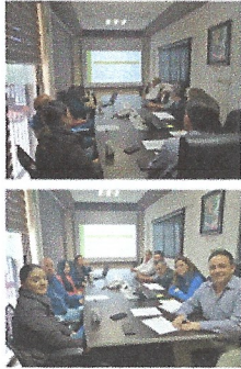
Evidencia del Cumplimiento PTCI Primer Trimestre