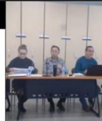
evaluacion calidad teams