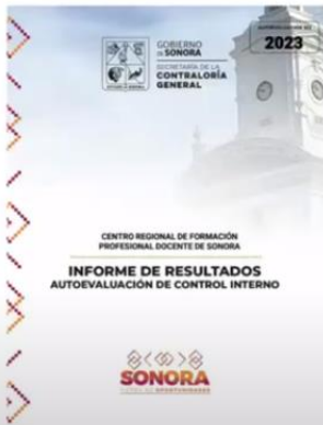
Anexo 1. Informe de Resultados 2023