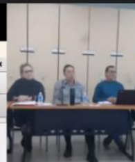
evaluacion calidad teams