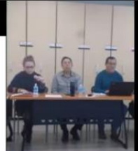
evaluacion calidad teams

POR C.P. GUADALUPE SALAZAR VALLE TITULAR DEL ÓRGANO INTERNO DE CONTROL