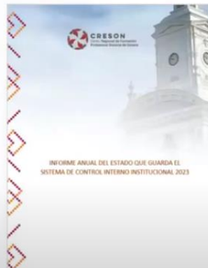
Anexo 2. Informe Anual 2023

POR C.P. GUADALUPE SALAZAR VALLE TITULAR DEL ÓRGANO INTERNO DE CONTROL